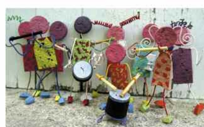
Les Sous-Fifres de Saint Pierre

C'est une bande, réunie sur 10 années... Chacun de ses membres, attachés à une culture de traditions, à l'esprit de fête, de convivialité, à l'autre... Embarqué dans une aventure musicale aux allures de Ripataoulère, la tribu, avance, perpétue une histoire... Par la transmission orale autour de la Ripata des Drôles - ateliers fifre et rythme le samedi matin... Du Bric Brac du 1er mai... Et du festival de Fifres - cette année les 28 et 29 juin... Activités à l'année ; cours, répétitions, ateliers, prestations... Retrouvez-les sur www.fifres.aquitaine-tour.com