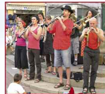
Le Bus Rouge