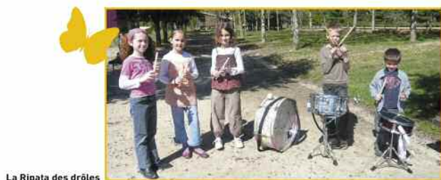
La Ripata des drôles